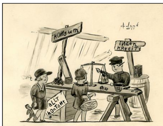
Handelns historia. Teckning ur Konsumentbladet av Piland.

Detta och säkerhetsaspekten har lett till att handelns organisationer propagerar för att kunderna skall använda betalkort.