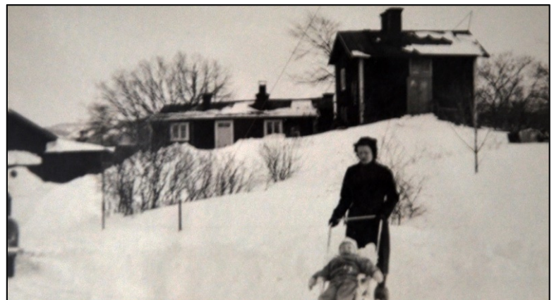
Två bilder från okänt år.