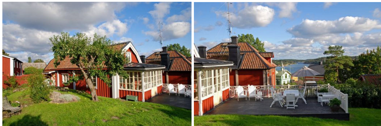
Foton från 2005.