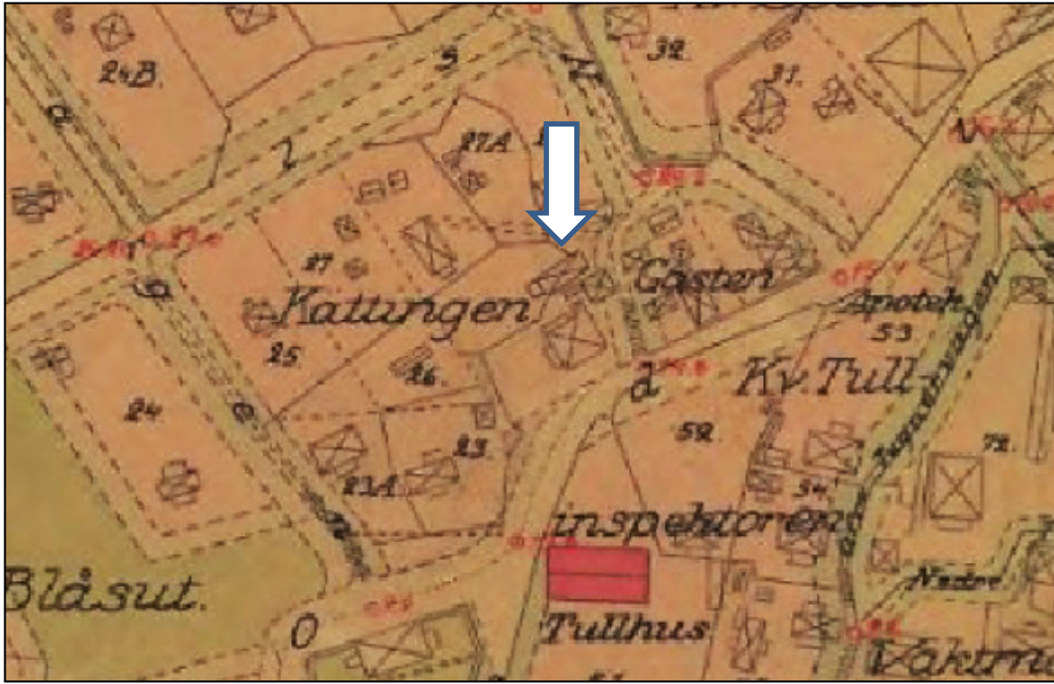
Karta från 1911.