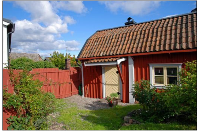
Foton från 2005.