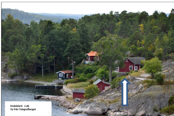
Smådalarö 1:26 Vy från Telegrafberget