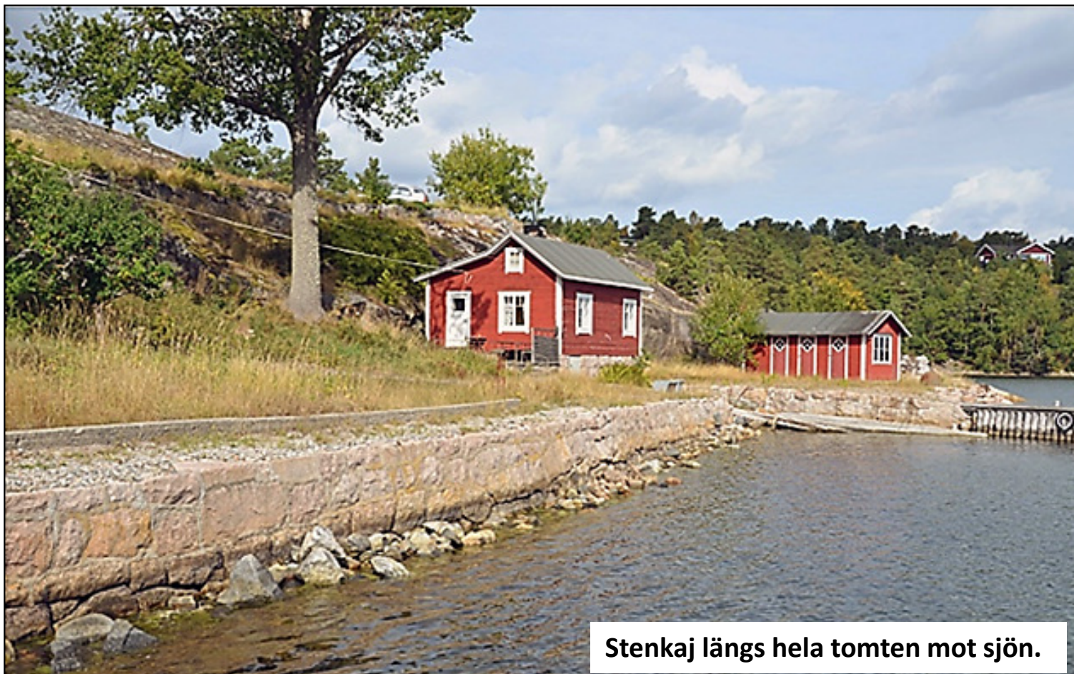
Stenkaj längs hela tomten mot sjön.