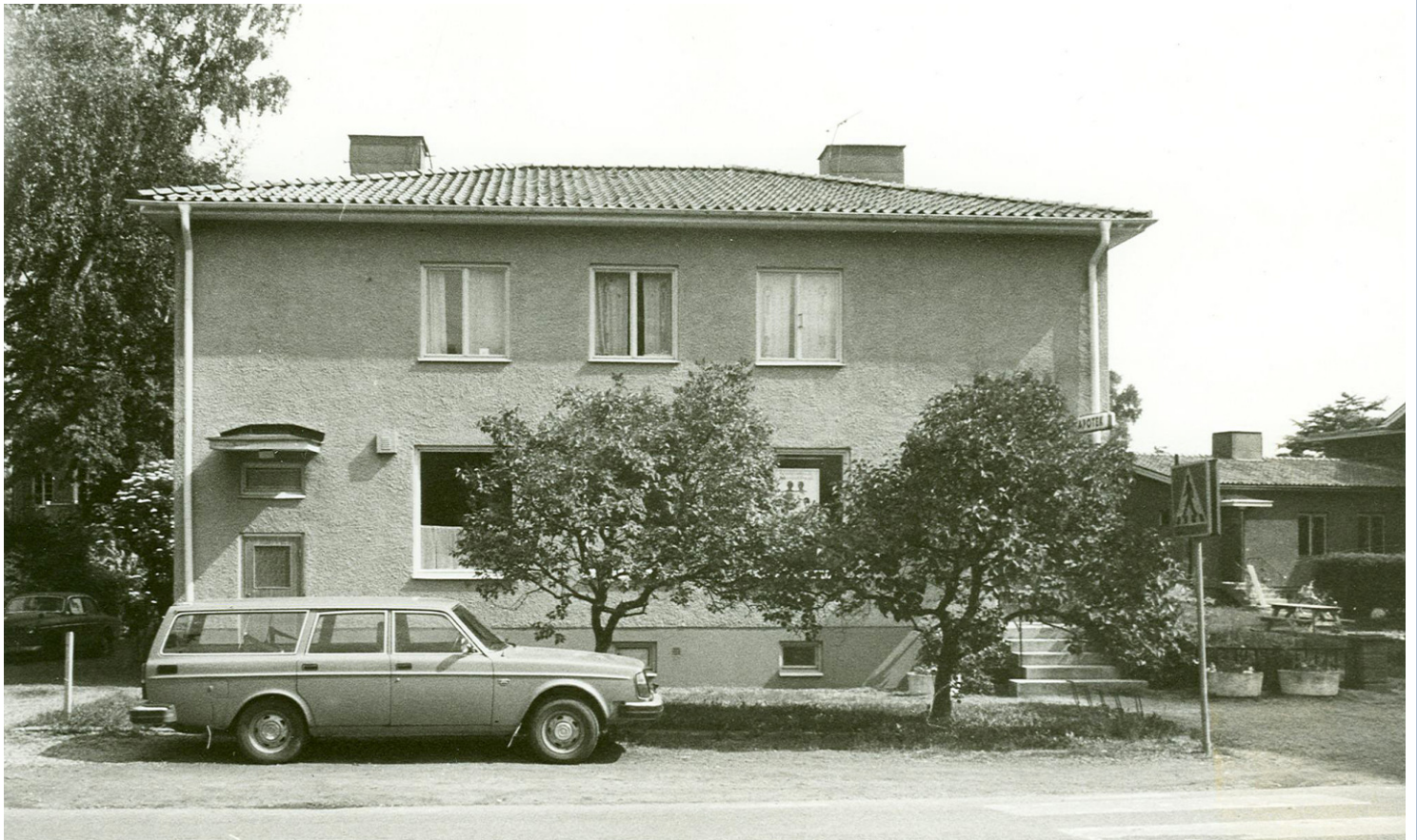
Odinsvägen 26B, Dalarö 4:5.

Här låg apoteket tills det stängdes den 27 april 1981.