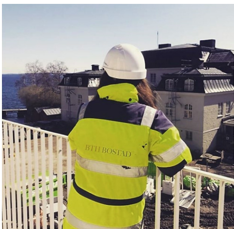
2018 Huvudbyggnaden kommer att byggas om till bostadsrätter.

2018 De flesta av byggnader är inflyttningsklara på Lyngsåsa.