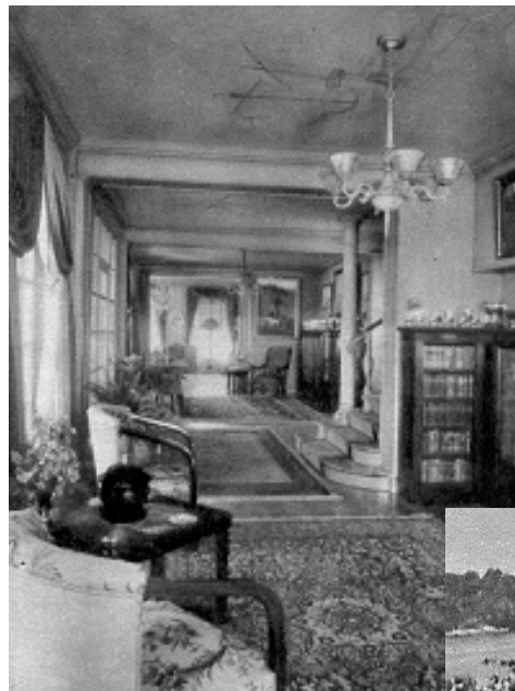
Ovanifrån generalkonsulinnan Ulla Åkerlunds boudoir med Kamkes porträtt av maken; sovrummet; vardagsrummet med vyn över Dalarö skans; längst ned en stålig fil av rum in mot salongen.