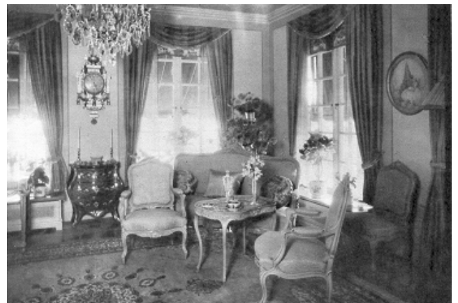
Salongen med en vacker rococomöbel från van der Nothska palatset.