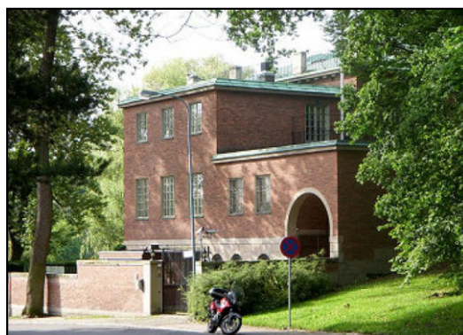
”Villa Åkerlund” i Diplomatstaden, Stockholm

Kronprins Fredrik och kronprinsessan Ingrid i solskenshumör