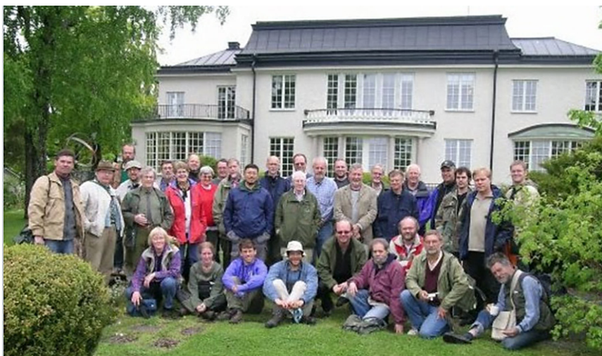
2005 då Frälsningsarmén bedrev sin verksamhet på Lyngsåsa.

1958 köpte Frälsningsarmén Lyngsåsa för sin skolverksamhet och öppnar Dalarö folkhögskola, som sedan drevs i 48 år tills skolan flyttade till Ågesta 2006 varvid de säljer till BTH Bygg, som 2016 påbörjar uppförande av bostadsrätter.