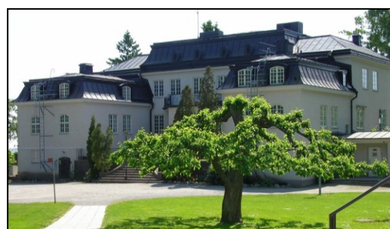
Bild av Lyngsåsa år 2002, då hade Frälsningsarmén folkhögskola i byggnaden. Baldersvägen 44-46.

Greta Garbo som Isolda • Erik Åkerlunds skärgårdsparadis