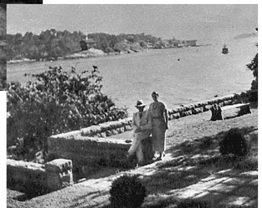
En vy över parken mot sjösidan