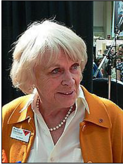
Ilon Wikland född 1930.

Litografier med Dalarömotiv gjorda av Ilon Wikland.