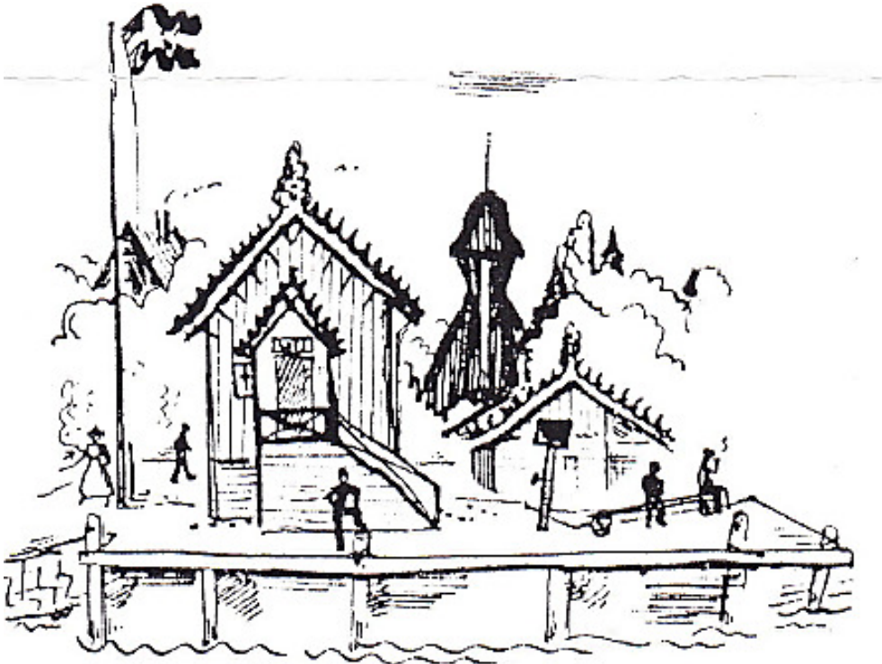
Illustration av Kurt Jungstedt. Notera hur lotshusets taksnickierier såg ut 1922.

På Utö firades och festades midsommar och Taube skrev den fina Utö-visan om hur dom fällde ankaret mellan "Mejt" och "Sif", tillägnad "tvenne hederliga och vackra svenska flickor".