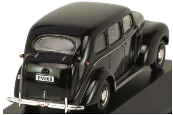
En Volvo taxi PV 800 några år yngre.