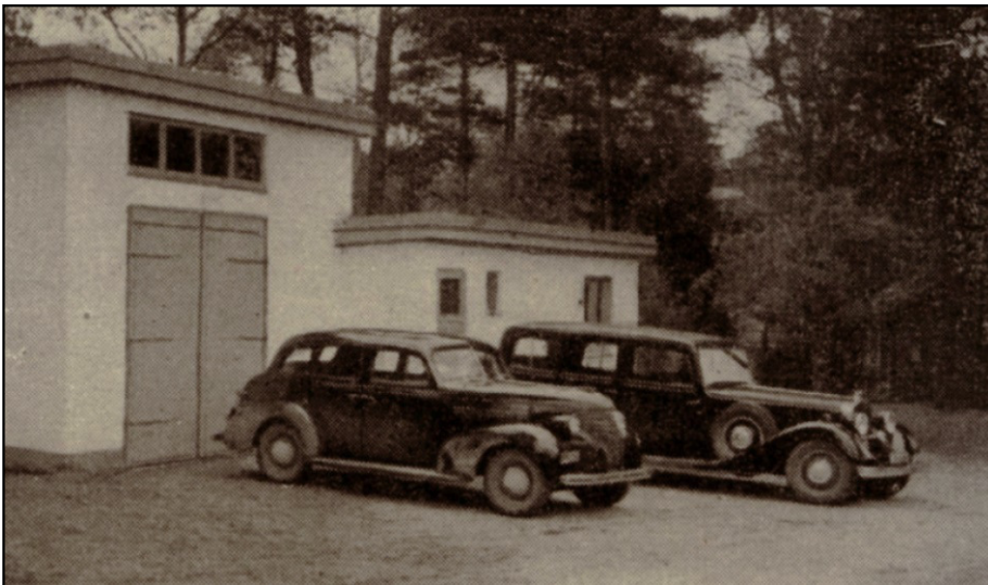
Foto troligen taget 1947 utanför brandstationen på Sveavägen. Bilen längst bort är en Chevrolet/Horch årsmodell 1939 och den närmast på bilden kan vara en Volvo PV 800 eller en Pullman årsmodell 1936.