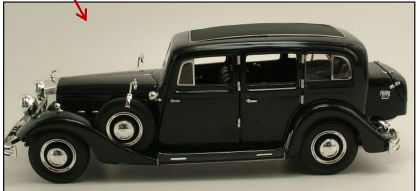
Chevrolet/Horch årsmodell 1939.