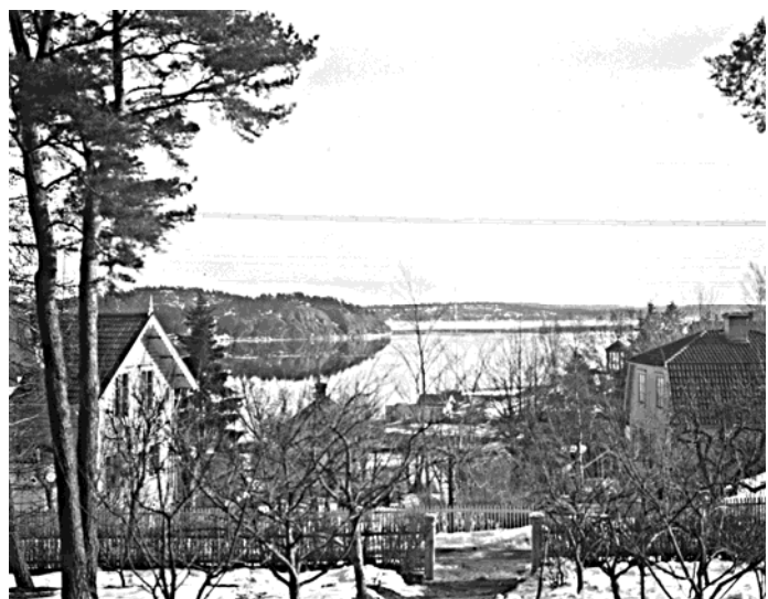
60: Utsikt från Baldersvägen 45. Lyngsåsas Ekotempel syns vid vattnet. Årtal ca 1925 innan Lyngsåsa byggdes.