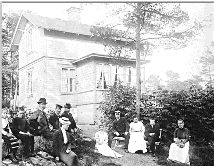
77: Obekant hus och stort sällskap. Vi saknar korrekta uppgifter om denna bild.