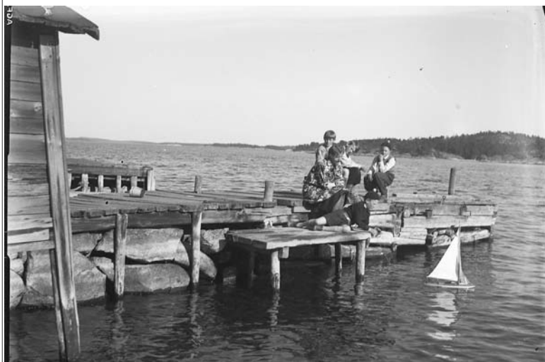
139: Pojkar som leker med segelbåt på Vana-disvägens brygga vid (Baldersvägen 52 – 54). Samma pojkar på bild 141 sidan 1 BR4.