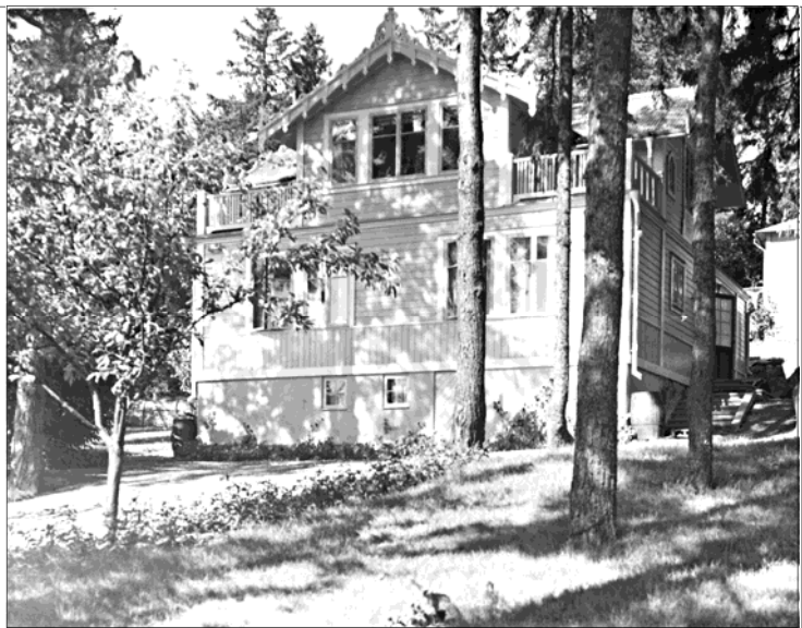
56, 57: Fotograf Gideon Rydells hus, Baldersvägen 45. Stora villan ovan och lilla villan nedan.