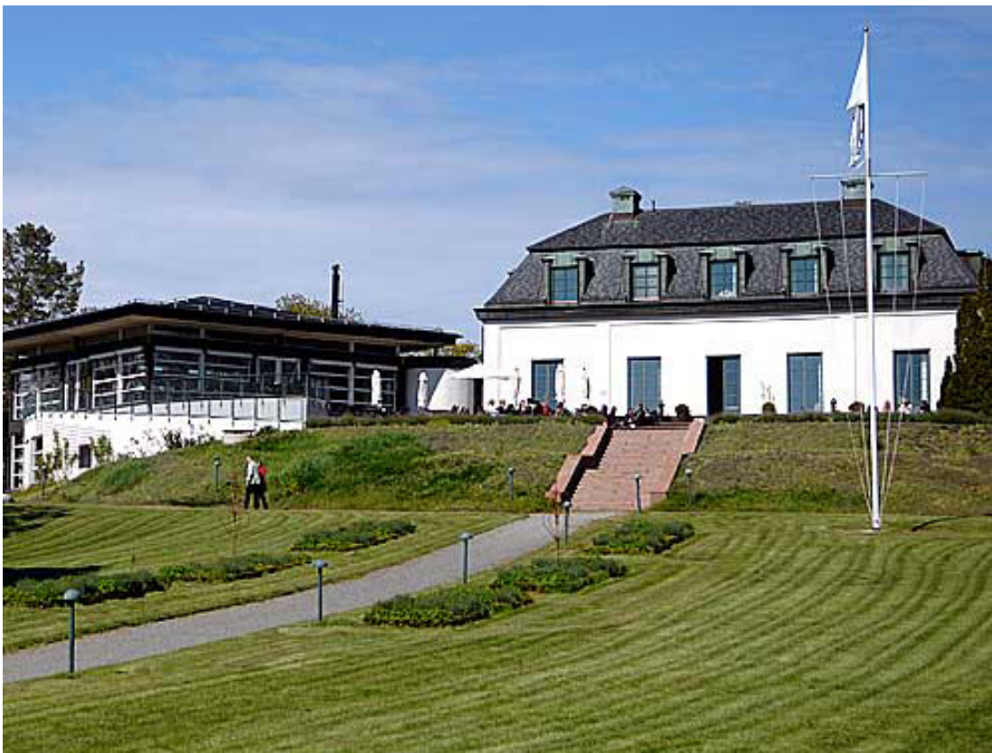
Nya matsalen 1990.