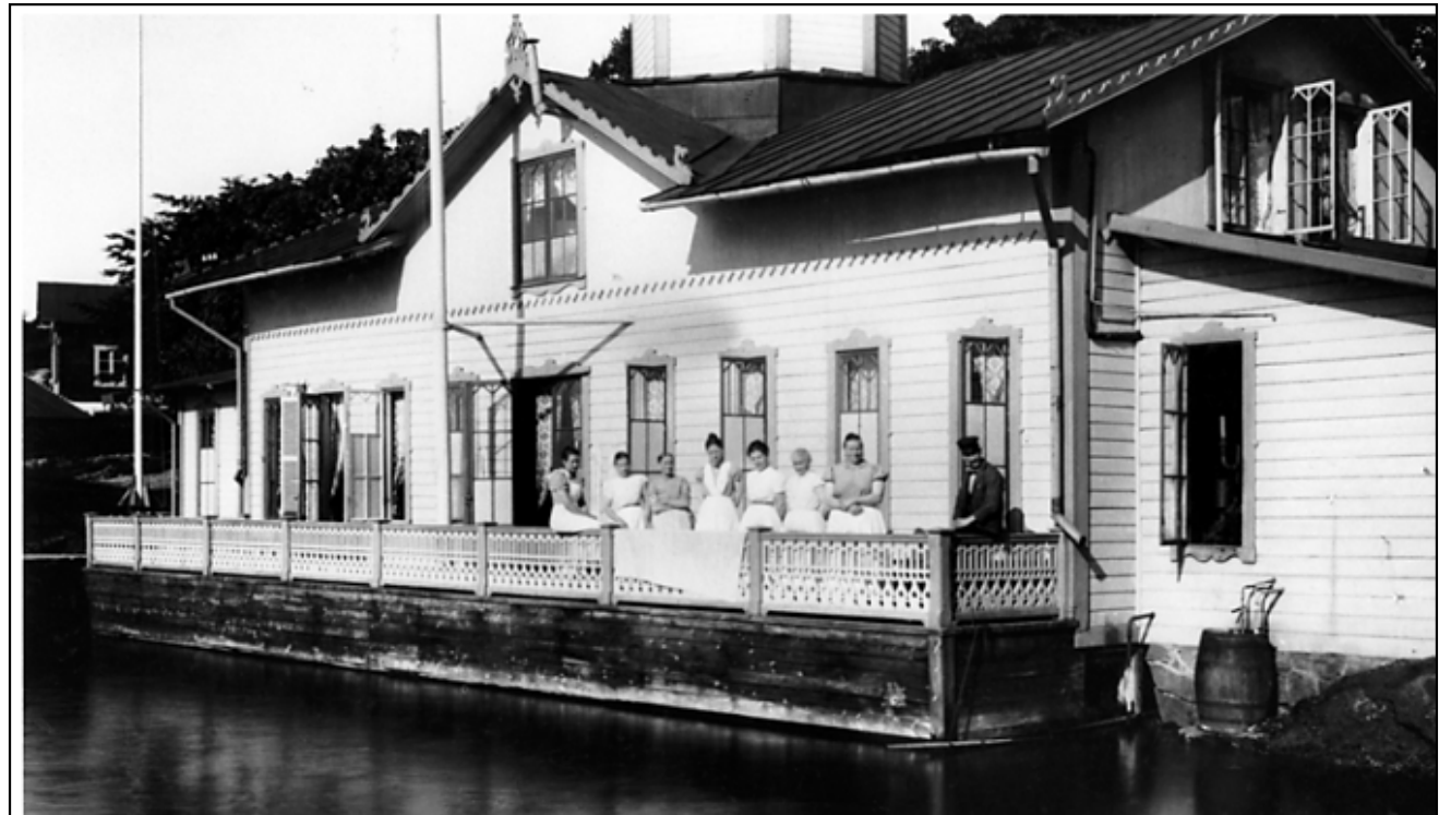
Varmbadhuset i Fiskarhamnen.