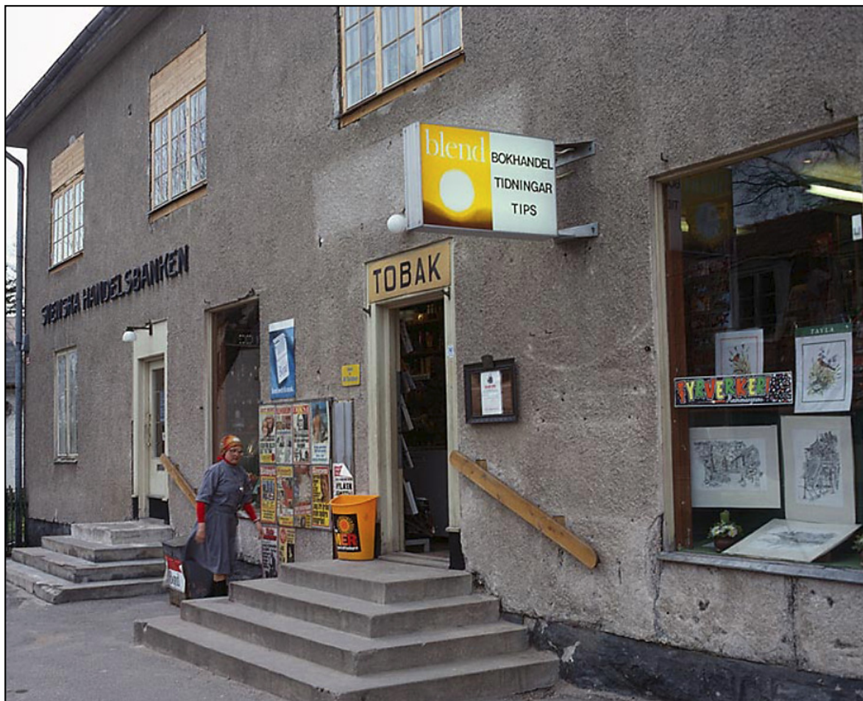
Bankhuset med tobaks- och bokhandel 1977.