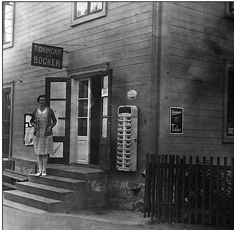
Siri i 20-års åldern.

Mer om släkten Hagberg och Hagbergska huset finns att läsa i DHF:s artikel A568.