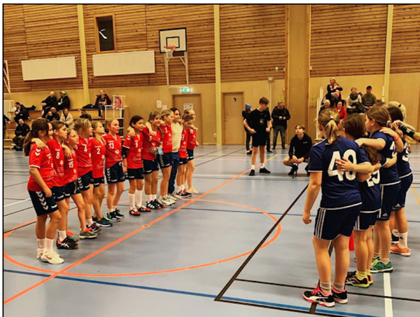
Dalarö möter Lidingö, okänt år.