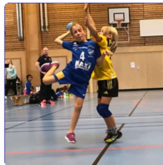
En dag i Dalaröhallen, Dalarölaget möter motståndare från Stockholmspolisen och Älta, 2017.