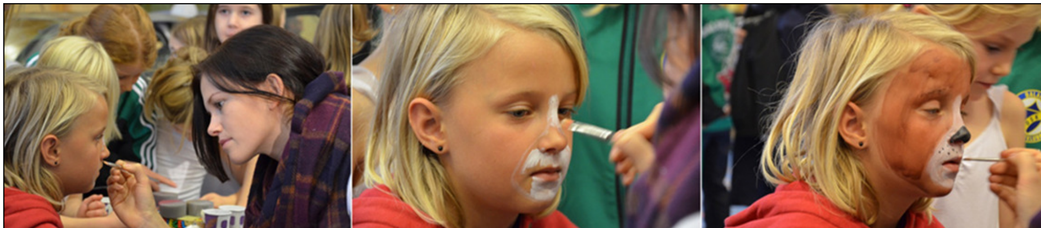
DSK firar 80 år i Dalaröhallen, 2012.