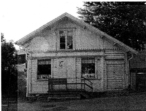
I den här lokalen upphör verksamheten vid årsskiftet

Kyrkan har nyligen sagt upp hyreskontraktet per kommande nyårsskifte. Men i stället finns aktuella planer på att slå samman museiverksamheten med Skärgårdsmuseets om det blir verklighet av planerna att flytta detta från torget till Tullhuset. SSIF och Dalarö Hembygdsförening har tillsammans skissat på hur lokaler i Tullhuset kan användas i framtiden, och förslaget har gått in till fastighetsverket i det förslagspaket som insänts i dagarna och som omnämns på annan plats i den här skriften.