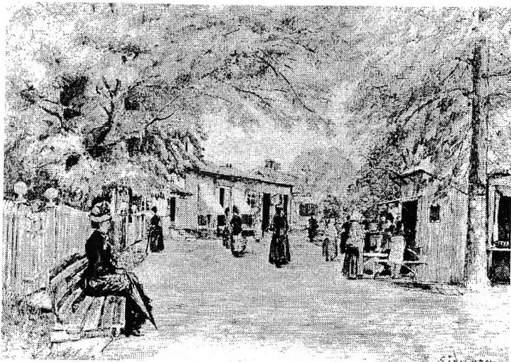
Gamla torget vid nuvarande Mysingen, sett söderifrån. Från en tavla av S Södergren, Nordiska museet

Sannolikt var detta lilla hus, som fanns på 1911 års karta, placerat något längre åt restaurang Mysingen till, på Dalarös första torg. Den tomt där nämnda restaurang ligger var intill förra sekelskiftet ett salutorg. Detta framgår också av den tavla signerad av S Södergren som visas här intill. Den visar på en torgverksamhet mittemot handlare Carl Carlsson, numera pizzerian. Bilden är ritad söderifrån mot nuvarande Dalarö torg. Man kan tydligt se två bodar med utfällbart tak och bänk. En tredje kan skönjas i bakgrunden. Snusmillans bod lär ha funnits bakom dessa tre bodar och där salufördes bl. a. cigarrer, tobak och snus.