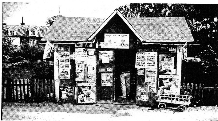
Kiosken fotograferad i augusti 1968