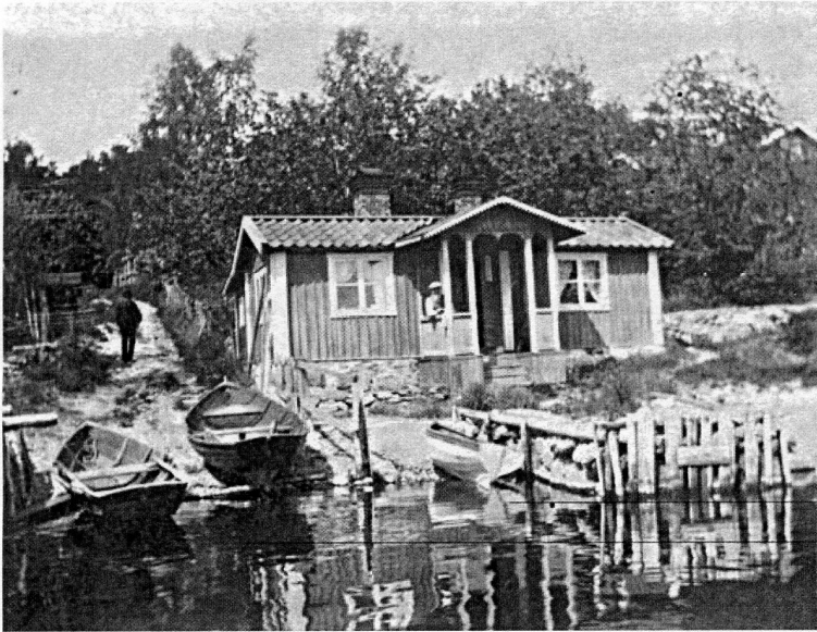
Lillstugan nere vid stranden invid Vanadisvägen. Den stora stugan kan skönjas uppe till höger.

Men han såg också till att umgås med författarvänner och andra konstnärer. Tvärs över vägen bodde