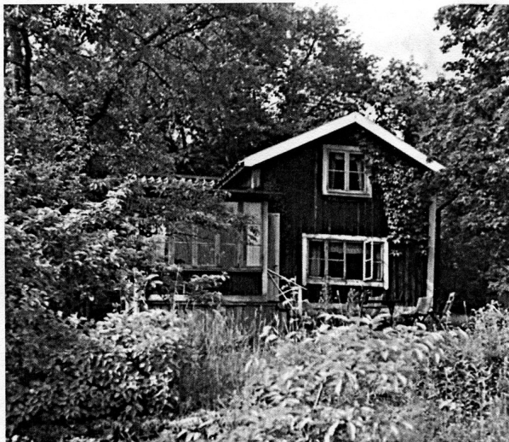
Stora stugan sedd från sjön. Glasverandan till vänster

Den vackert gröna grinden mot Baldersvägen är tidstypisk och har som låsregel en vev från en gammeldags kaffekvarn. Tidigare låg på varje grindstolpe ett vitmålat klot som prydnad. Det var kanonkulor bärgade från "Riksnnyckeln". Någon klåfingrig person stal dem för ett antal år sedan, till stor sorg för familjen. På tomten fanns och finns många olika lövträn även om en del har måst tas bort för att de börjat murkna.