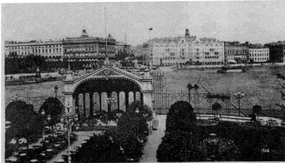
STOCKHOLM: STRÖMPARTERREN OCH NORRA BLASIEHOLMSHAMNEN.

forskade vidare och skrev sedan ned berättelsen som infördes i Svenska Dagbladet.