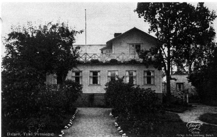
Tykö pensionat var ett mycket uppskattat pensionat bland flera på Dalarö på den tiden.