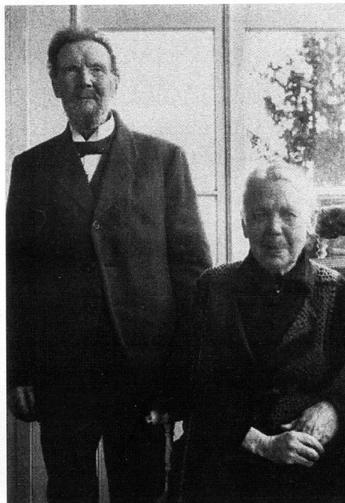
Farfar och farmor var värmlänningar.

född så sent på året. Det var lång väg för en sexåring att knalla iväg varje dag till skolan. Han gick utefter stranden vid Vadviken, Idunstigen i dag, för det fanns en ilsken hund på Baldersvägen. På hemvägen skulle han ta med mjölkflaskan från Nor-