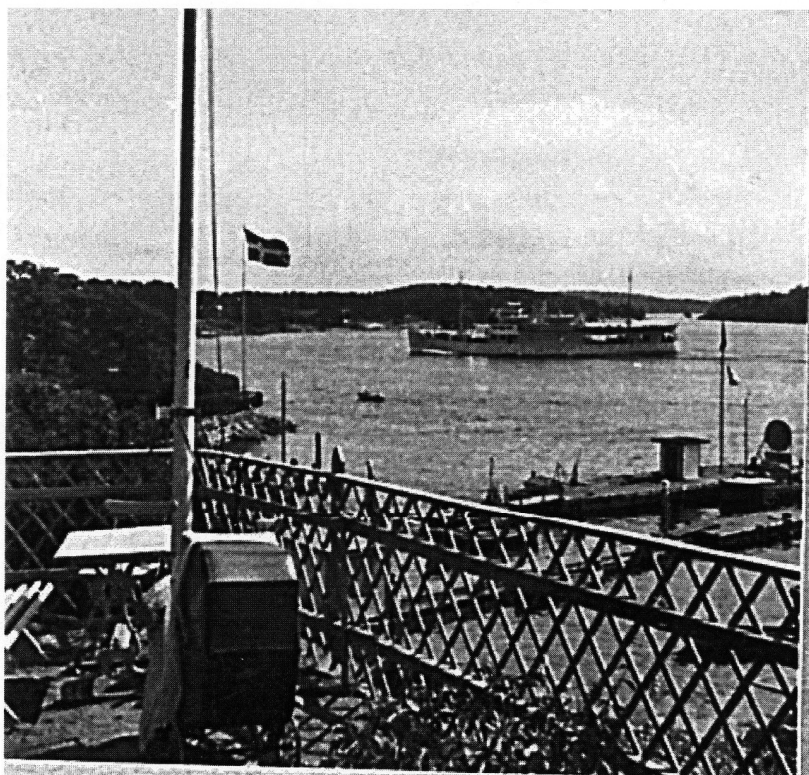
Utsikt från Sofias terrass. Vi förmodar på trettioalet.