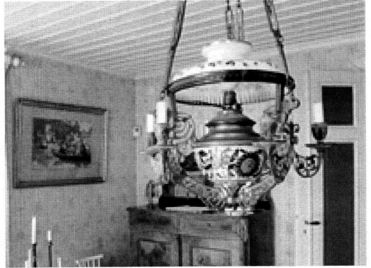
En taklampa som sannolikt hängt här sedan 30-talet.