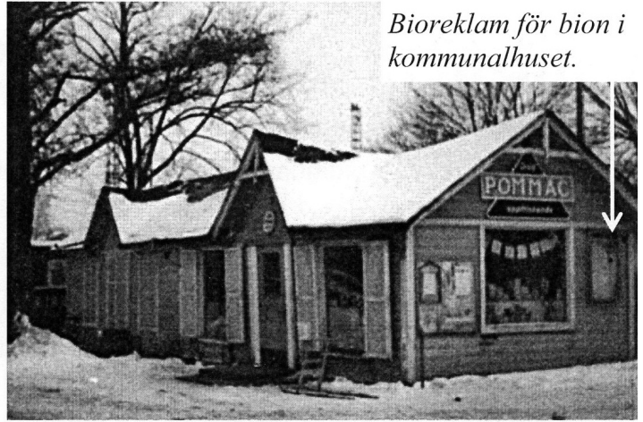
Bioreklam för bion i kommunalhuset.