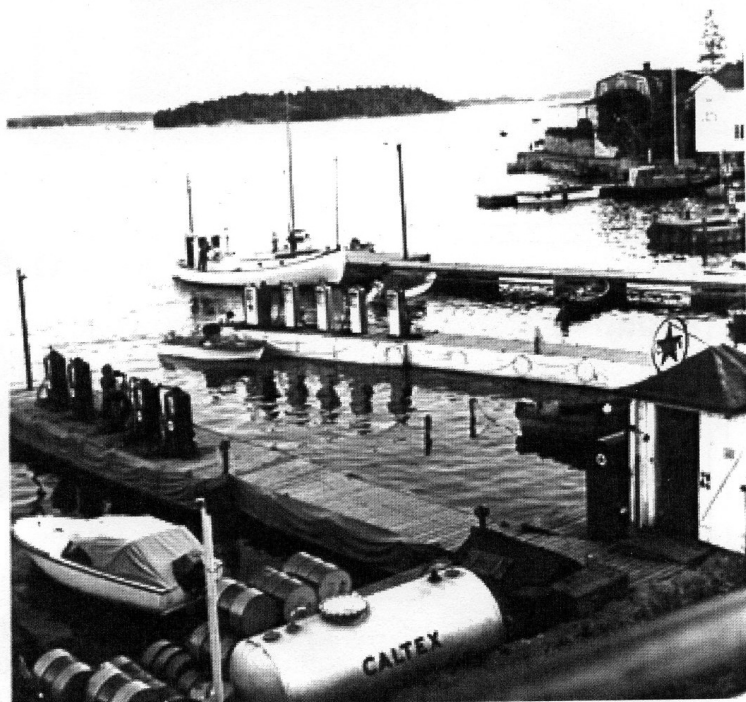
Utsikt över bensinstationen. Då var det Caltex och BP. 60-talet.

Sandbergarna var en väl etablerad släkt på Dalarö som bodde sedan 1810 just intill Kockens udde, Tullbacken 7. Det var Svens mor, Augusta som i början av 1920-talet började sälja drivmedel med