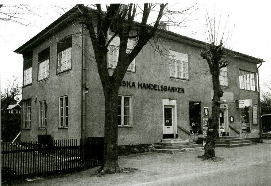
SHB huserade i 66 år på gatuplanet i södra delen. Sedan 2003 hela gatuplanet. Tidigare bl a en bok- och tobakshandel och efter det frisör på norra sidan.