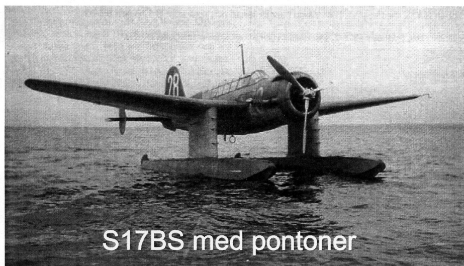
S17BS med pontoner

Flygplanen av SAAB:s typ 17 levererades kring 1940. Uppgiften var bombfällning och spaning och maskinerna kunde för-ses med landningsställ, skidställ eller pontoner. Sju stycken låg i Vadviken mot slutet av kriget.