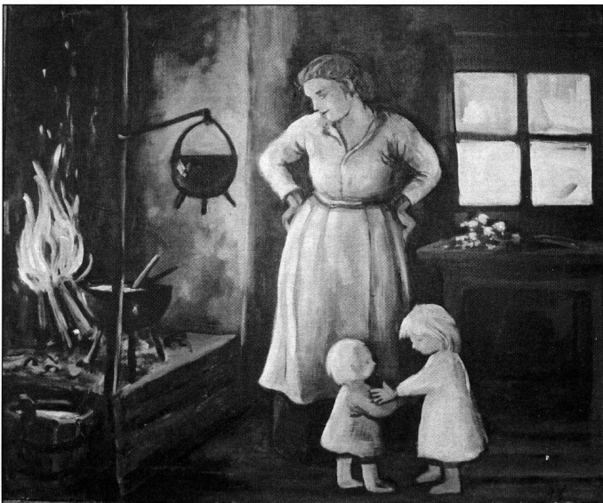
Carolina bröt ensamheten och snart blev de ett kärlekspar och barnen kom.

Denna utveckling kom även skärgårdsbefolkningen till del. De fick allt oftare möjlighet att tjäna reda pengar för sitt arbete. Detta gällde även arbete som utfördes lokalt på Dalarö. Tidvis var också Israel Segerberg med och arbetade för socknens räkning