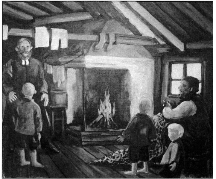
Pastor Söderén uppmanade Israel att gifta sig för att undvika skvaller och smussel.

År 1851 flyttade hon ut för att ta hand om hushåll och lagård på Edesö. Israel hade gått länge med sin