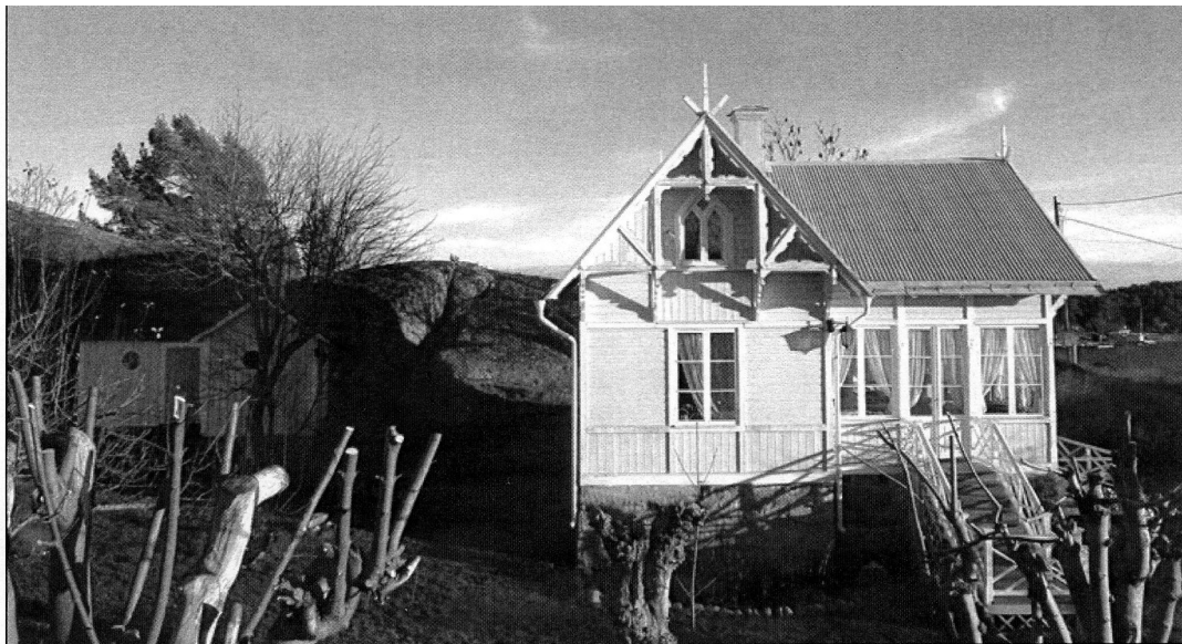
Wallinvägen 10 hösten 2015. Bergets kontur bakom husen känns igen. Korsholmen skymtar till höger i bild.

varegård. Detta skulle ha skett i slutet av 1830-talet eller början av 1840-talet. Kanske var det så att mamsell Wiberg hade skaffat sig sin "titel" då hon kom tillbaka till Dalarö. Att ha arbetat som bodbiträde i Stockholm gjorde att hon kunde hamna betydligt högre upp i bysocietyten och därför hade rätt att kalla sig "mamsell". Till och med pastor Södrén tycks ha accepterat detta och titulerar henne "mamsell" i kyrkböckerna.