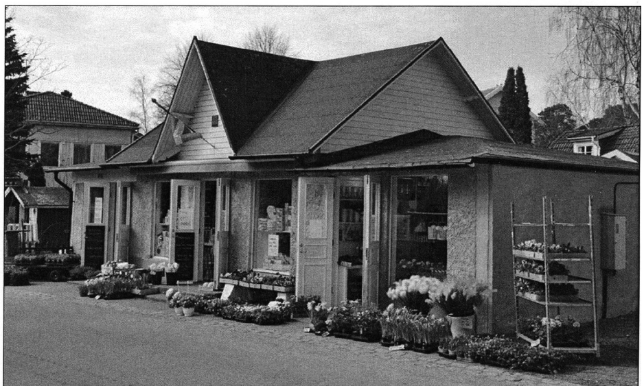
Lanthatandeln har renoverats för några år sedan men helt bibehållit den traditionella ursprungliga karaktären.