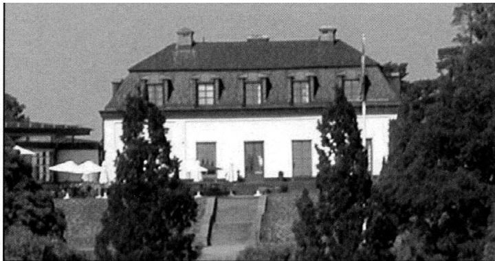
Huvudbyggnaden sedd från södra sidan.

Ansökan om att bygga en gångbro av trä mellan fastlandet och Rosenön inlämnades 1939 av familjen Söderberg, men bron byggdes först 1947. Brobygget var ett beredskapsarbete med bidrag och lån från Staten. Gångbron låg ungefär där nuvarande bilbron går. Rosenön var således en ö utan landförbindelse fram till 1947.