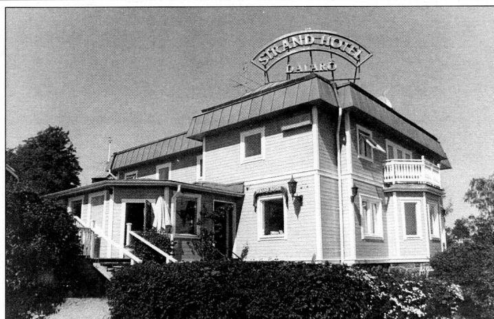
Hotellet som det såg ut på 2000-talet innan det revs 2019.

Våren 2019 revs byggnaden och en parkeringsplats anlades på tomten.