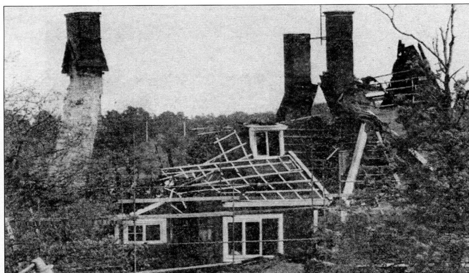
Hotellet brandskadades kraftigt vid branden den 21 september 1893.

En följd av branden blev att Dalarös första stadsplan fastställdes 1899. En annan följd var att en allmän grusväg anlades runt Spegels udde.