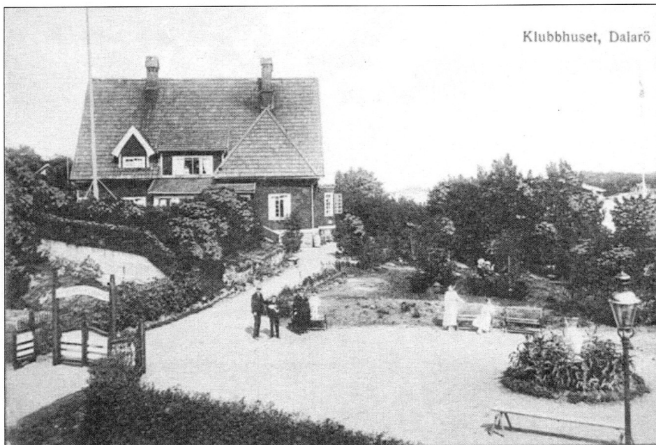
Hotellet (klubbhuset) som det såg ut på 1910-talet. På planen utanför hotellet stod en gång på 1920-talet en musikpaviljong.

Den 30 september 1890 startar elden i vindsvåningen till Dalarö Hotell, och snabbt var hela hotellbyggnaden övertänd. Eld och gnistor for över Odinsvägen och antände byggnader på nuvarande Strand Hotell tomt. Dalarös tre brandsprutor förs fram, elden är svårsläckt p.g.a. den orkanliknande stormen och man koncentrerar sig på att begränsa spridningen. Från Stockholm kommer två båtar med manskap och brandsprutor. Samtliga stockholmstidningar uppger nedbrunna byggnader till tolv.