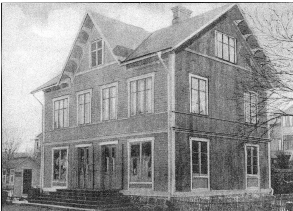
Vykort från ca 1910.