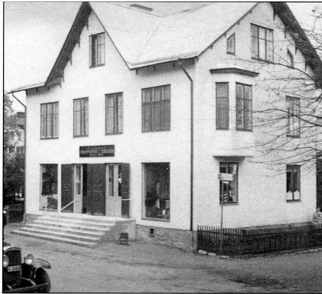
Bild från 1938. Då med affären N. E. Jakobs- sons Manufaktur & Sybehör.