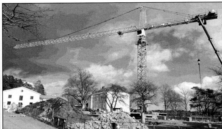
Tornkran med ca 70 meter i räckvidd.

Läs om nya hotellet på länken: www.smadalarogard.se/nya-hotellet/