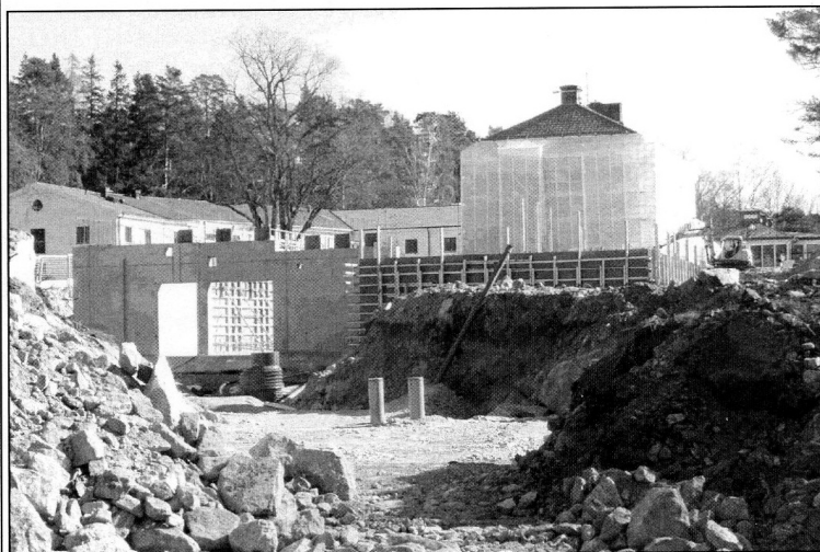
Källarväggarna tar form i tillbyggnaden.