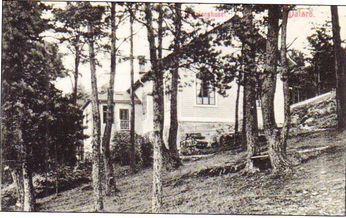
Ett vykort med missionshuset från början av 1900-talet. Huset sett från sydväst.

slutet av 1899 lämnade 17 medlemmar Dalaröförsamlingen för att bilda en ny församling.