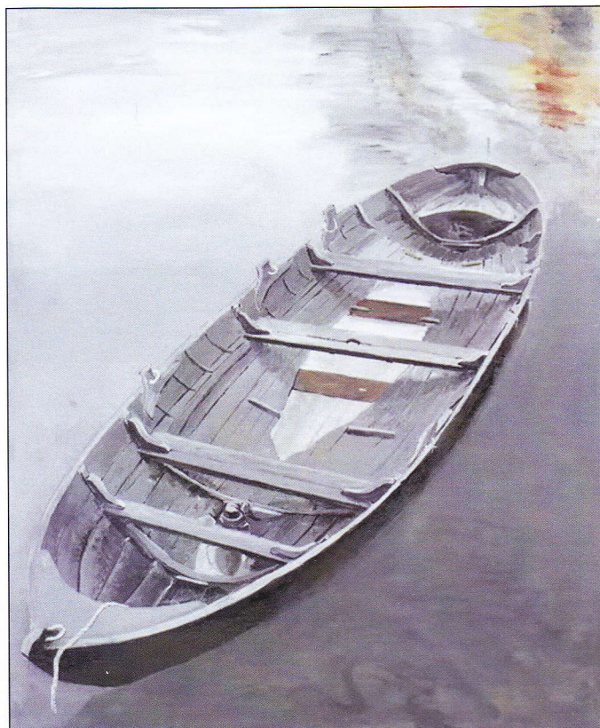
Roddbåt på Djurgårdens nya varv. Akryl på duk.

första lärospån vid École supérieure d'art et de design i Toulon, södra Frankrike. Väl åter i Sverige via Gerlesborgsskolan, sökte han till Konstfack och kom till sin förvåning in där. I valet mellan olika specialområden såsom teckning, måleri och möbler valde han teckning och måleri. Sammantaget har han omkring 8 års konstnärlig utbildning. Sitt utlopp för det mer handfasta hantverket får han genom design och konstruktion av exempelvis möbler. På Dalarö har han exempelvis designat två bord av ek som fällt på tomten och som nu pryder sin plats i vardagsrummet.