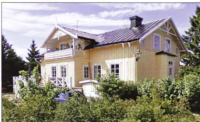
Henriksberg, senare döpt till Floryhof på Wallinvägen 11. Byggår 1864.