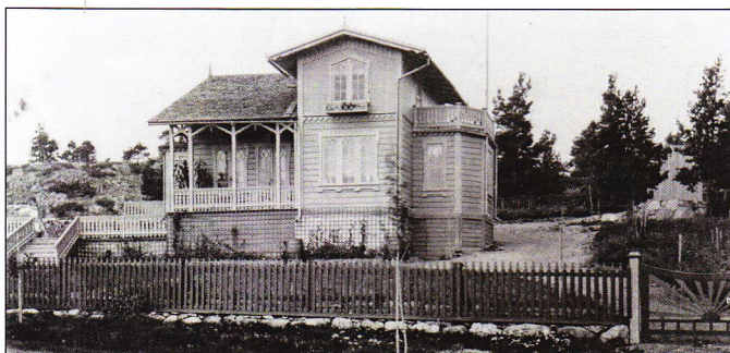
Villa Fridhem, Odinsvägen 37A. Byggår 1866. Foto från år 1886.