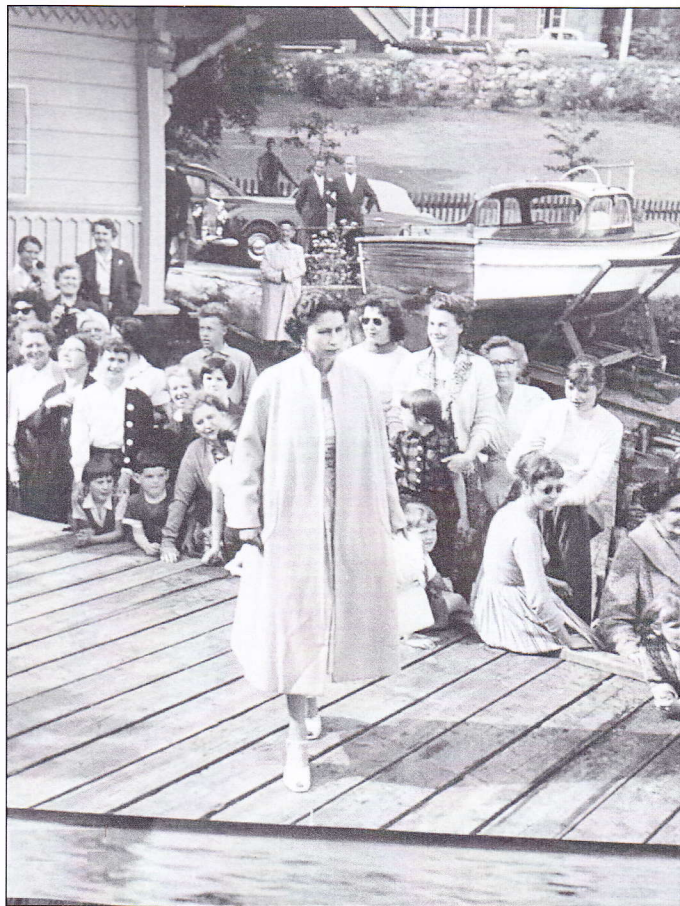
Drottning Elizabeth på bryggan i Fiskarhamnen. I bakgrunden syns tullstugan, senare våffelstuga.