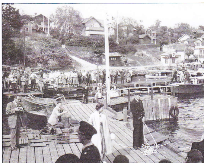
Fiskarhamnen fylldes snabbt med åskådare när det blev känt att kungligheterna skulle återvända efter lunchturen till Fjärdlång.