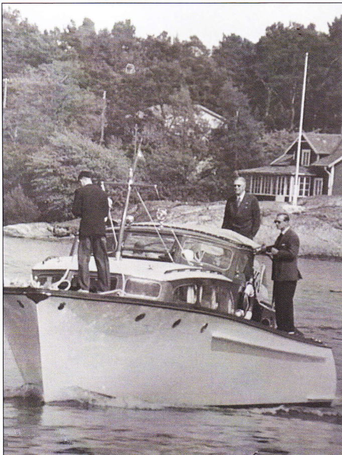
Här anlöper lustjakten "Gunilla" Fiskarhamnen efter lunchturen ut till Fjärdlång. I mitten står kung Gustaf VI Adolf och hertig Philip till höger. I bakgrunden syns Korsholmen.