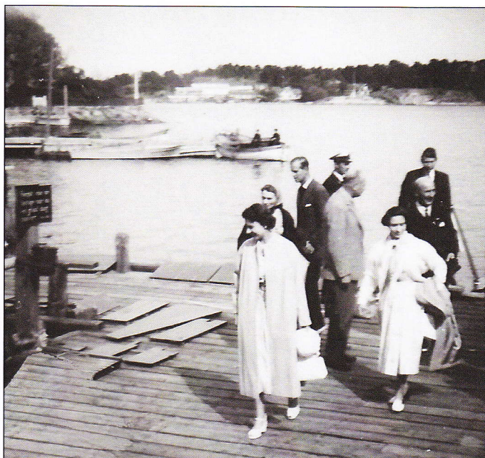
Drottning Elizabeth med sin syster Margaret till höger. Korsholmsvarvet skymtar i bakgrunden.

Fakta: Drottning Elizabeth ankom till Stockholm den 8 juni 1956 med båten "Britannia" och reste hem med flyg från Bromma den 17 juni.