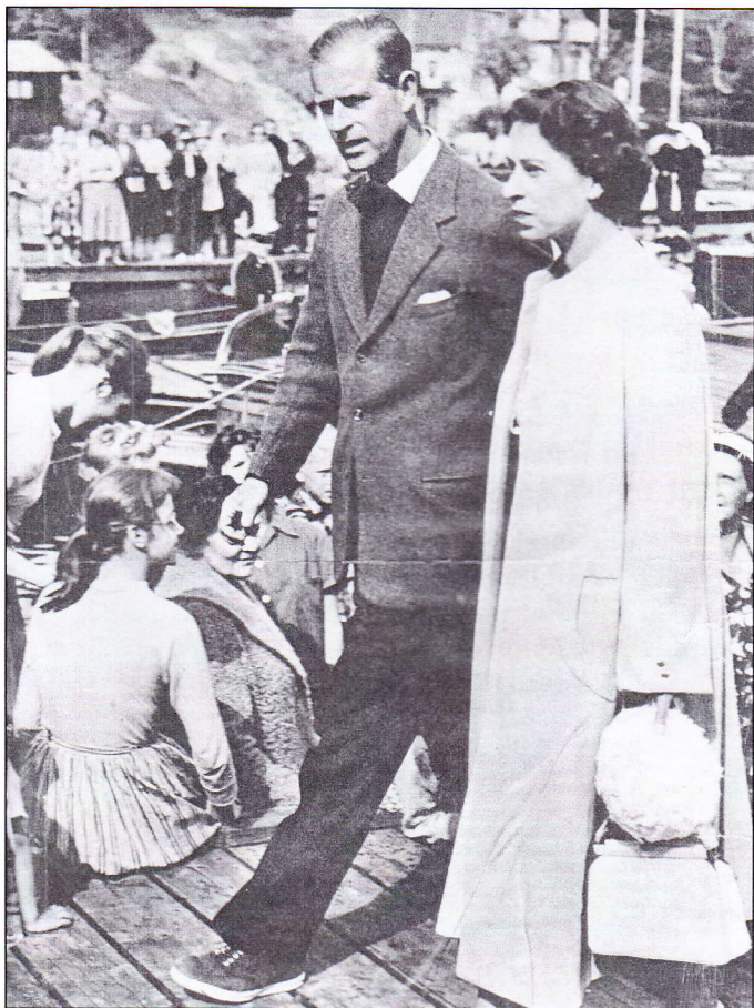
Drottning Elizabeth med hertig Philip efter sjöturen.