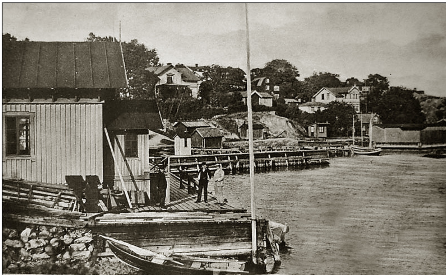
LOTS- OCH TULLBRYGGAN. DALARÖ.