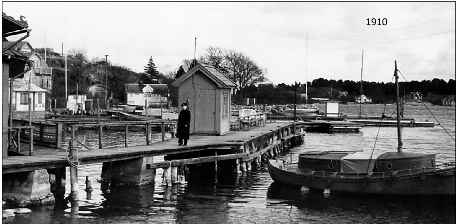
Vaktkuren på tullbryggan.