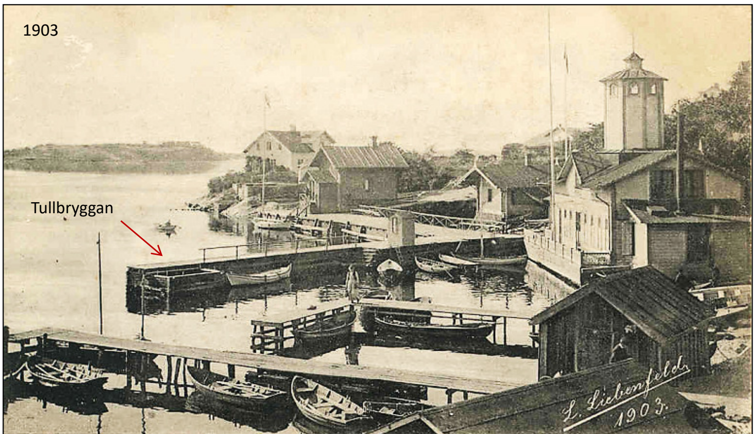
Här syns de hopbyggda bryggorna.