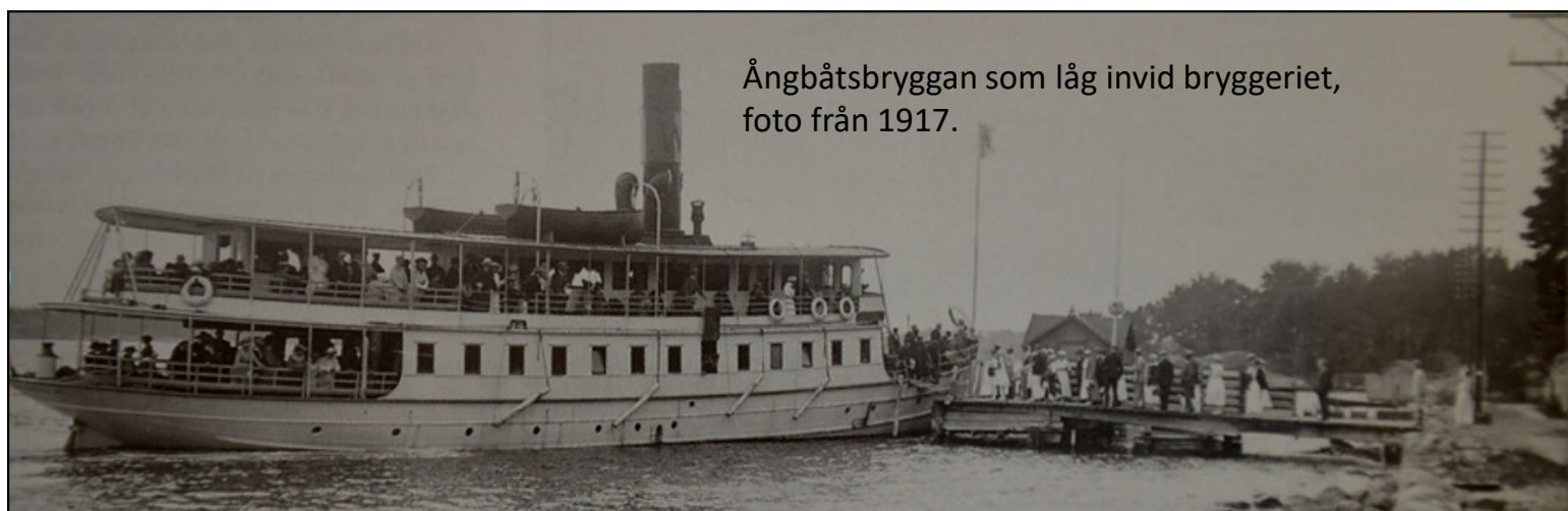
Ångbåtsbryggan som låg invid bryggeriet, foto från 1917.