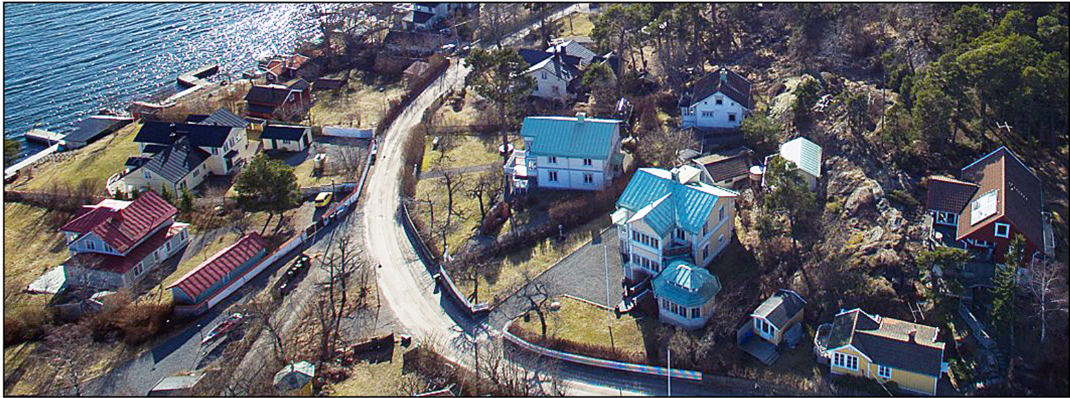
7 foton från 2017.