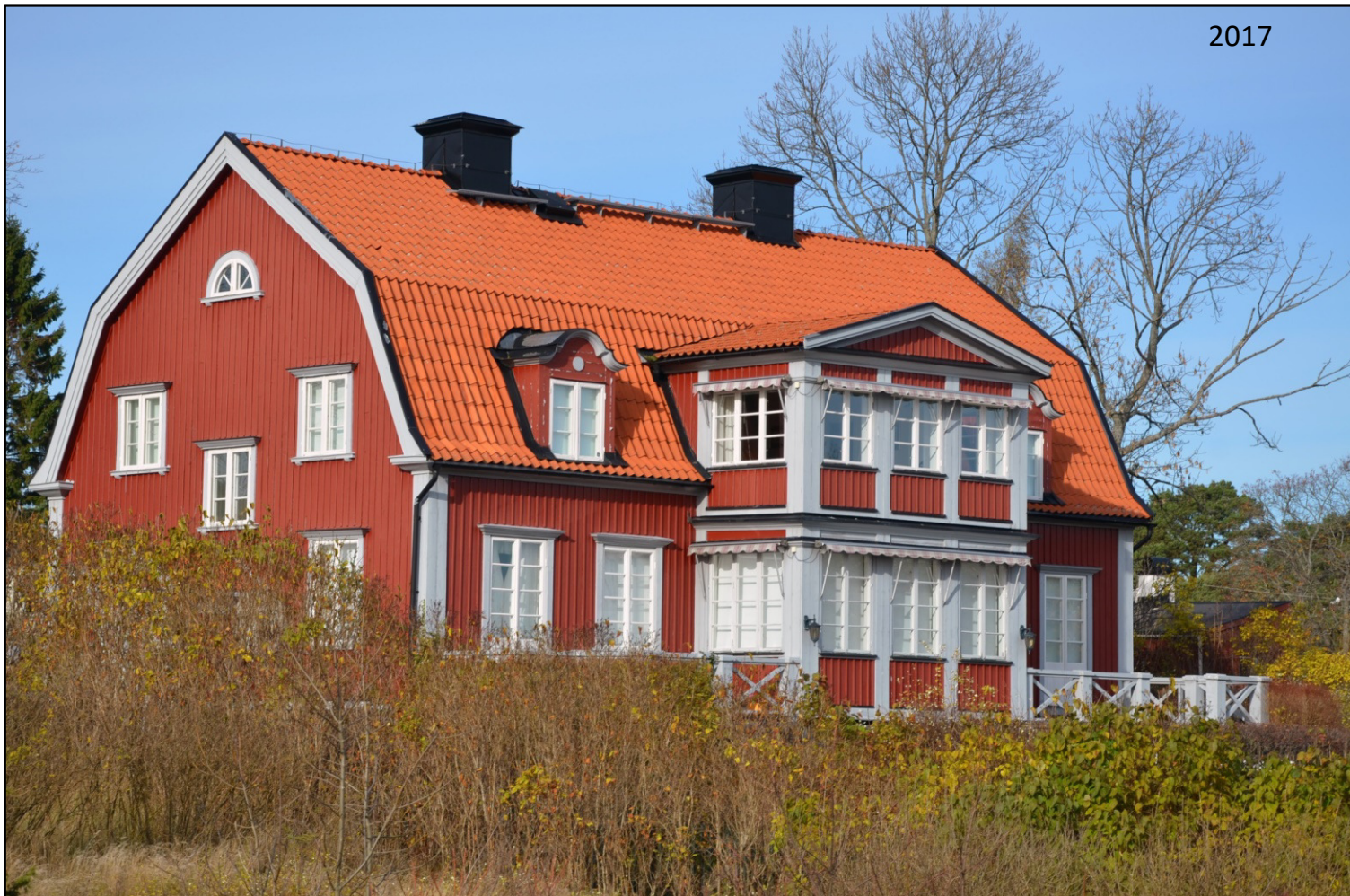
Fasad mot sjön.