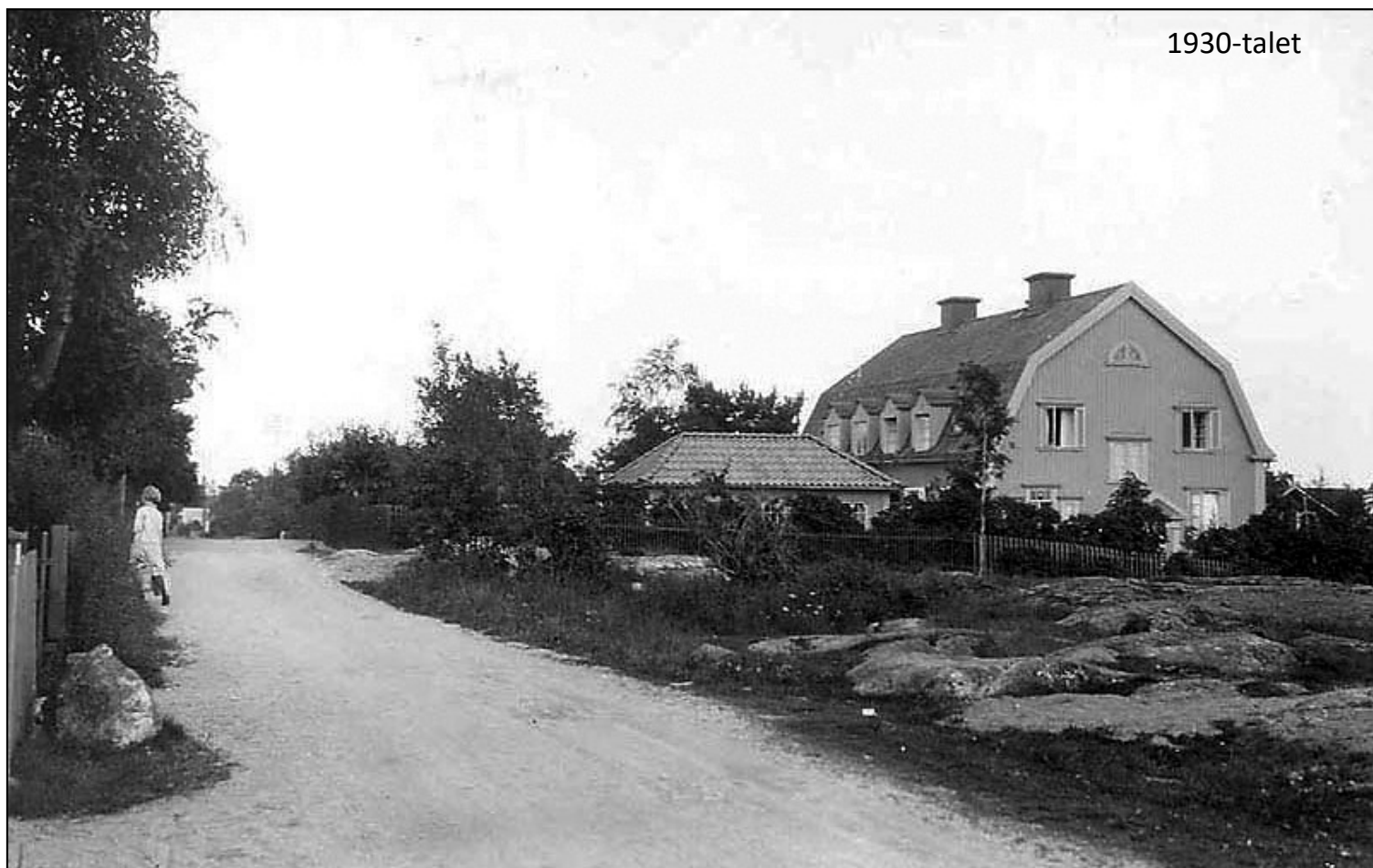
Vy från Birger Jarlsvägen.