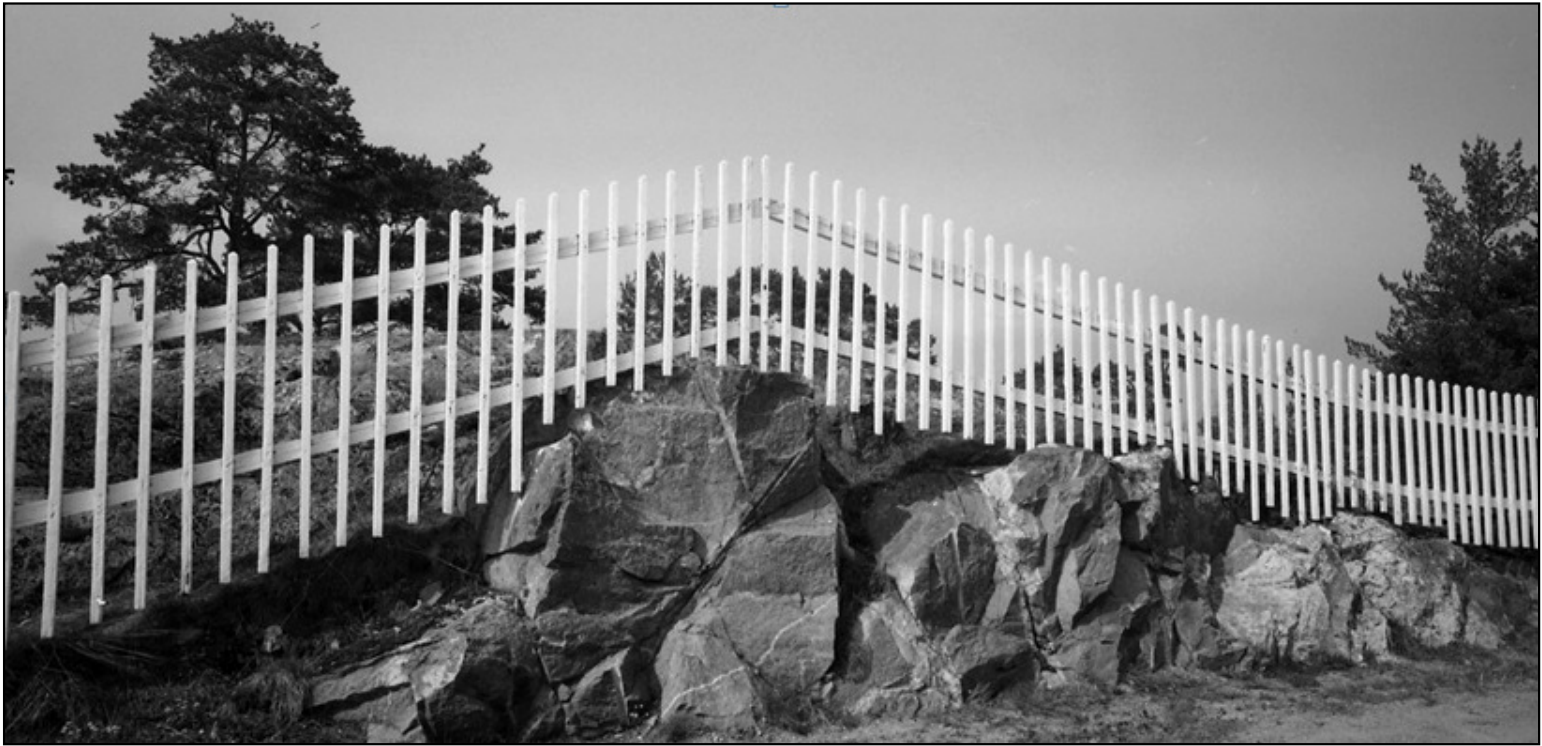
Här en bild tagen på 1980-talet av samma staket men nu utifrån Torsvägen.