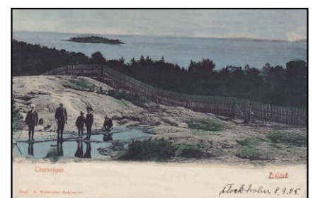
Vy mot Jungfrufjärden.