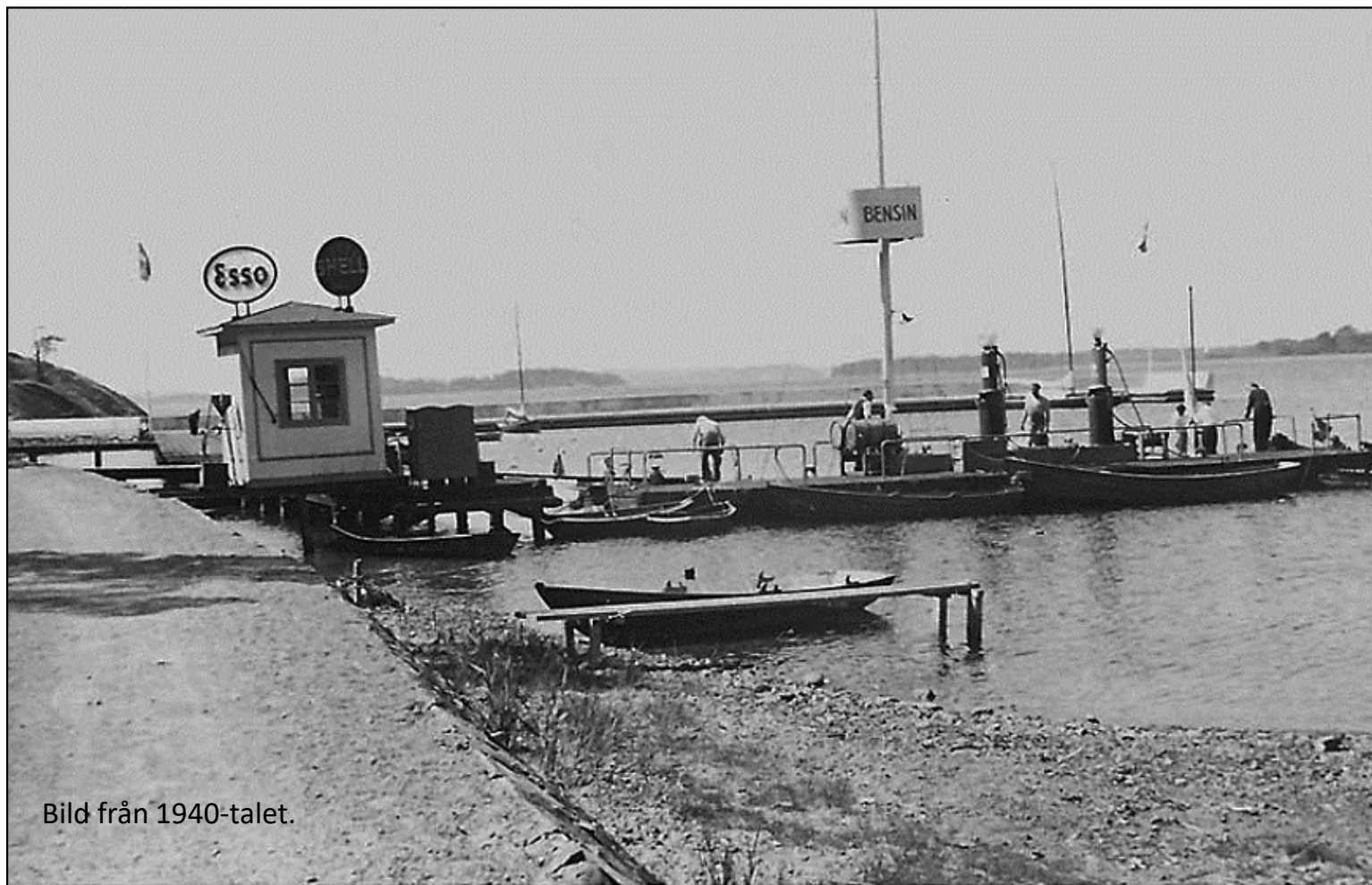
Bild från 1940-talet.

Bensinstationen i Askfatshamnen sedd ut mot Sandemarsfjärden. I bakgrunden syns piren som byggdes 1939 i samband med att Dalarö kanal byggdes, piren skyddar hamnen mot vågor från söder.