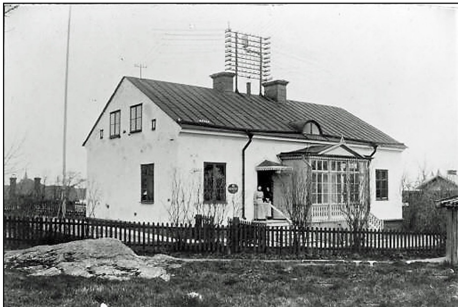
Dalarö telegrafstation i början av 1900-talet på Postvägen 3.