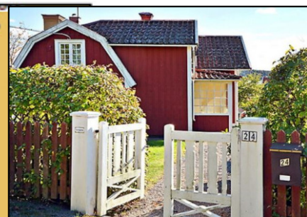
Vy från Wallinvägen 24, 2018.