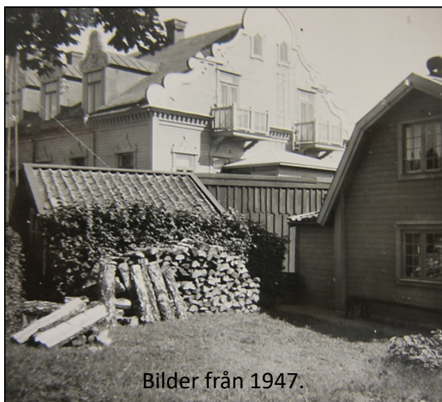
Bilder från 1947.

Vi var tre systrar och två bröder. När familjen ökade byggdes huset till och även vinden vinterbonades och där bodde något av barnen. Ett stort rum byggdes till och en stor veranda och köket gjordes om.