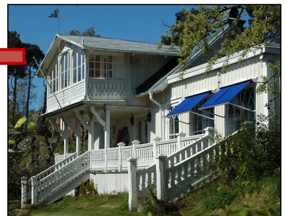
Karta från 1911. Bild från 2015.