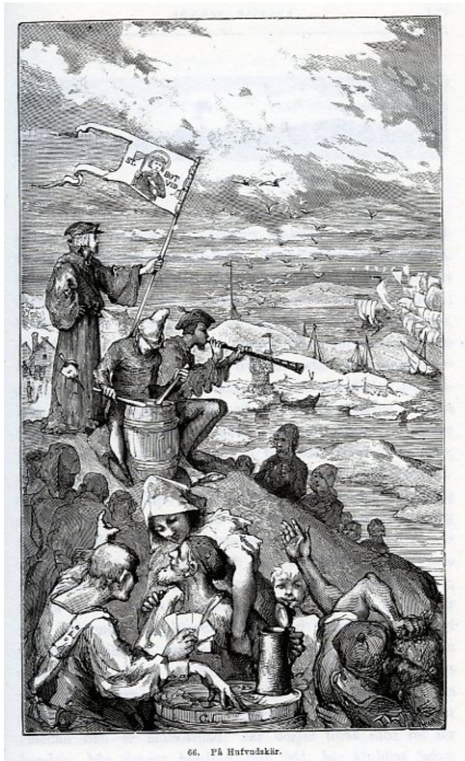
66. PÅ HUVUDSKÄR.