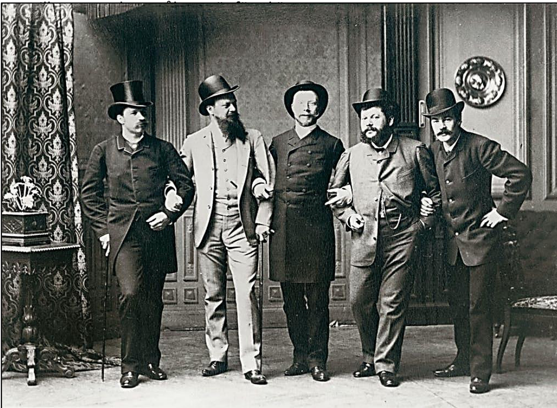
Vid mitten av 1880-talet framförde de så kallade Opponenterna kritik mot Konstakademien. Carl Larsson (i mitten) var drivande, liksom Ernst Josephson (höger om Larsson). Med på bild är även Per Hasselberg, August Hagborg och Richard Bergh.