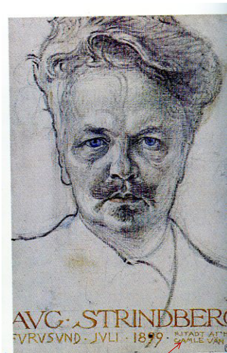
RITAD AV HANS GAMLE VÄN