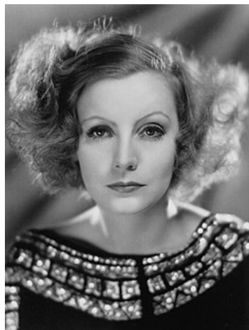
Greta Garbo 1931.