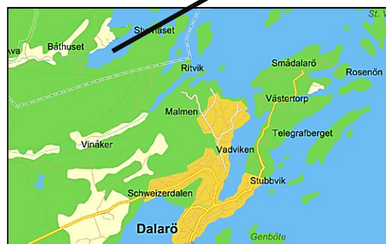
Karta från 2012.