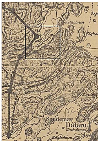
Karta från ca 1870.