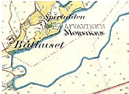
Karta från 1901-06