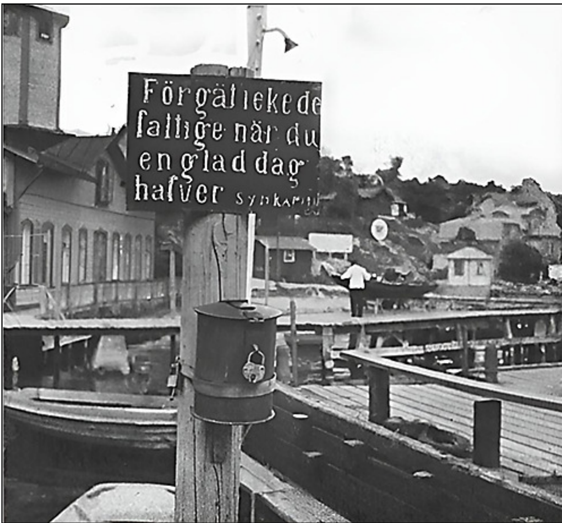
Fattigbössan när den satt på bryggan i Fiskarhamnen. Bild från 1930.

I förgrunden, vid bryggan, ligger en lotskutter och i bakgrunden t. v. syns varmbadhuset med sitt torn.