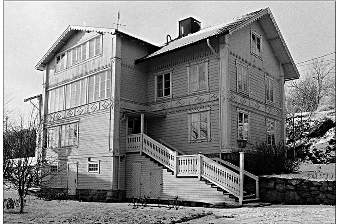
Gammelgården Odinsvägen 5.

En fattigbössa finns även i Gammelgården, i församlingens lokaler Odinsvägen 5. Bössan sitter nu på övervåningen, på räcket vid trappan. Var den funnits tidigare är okänt.