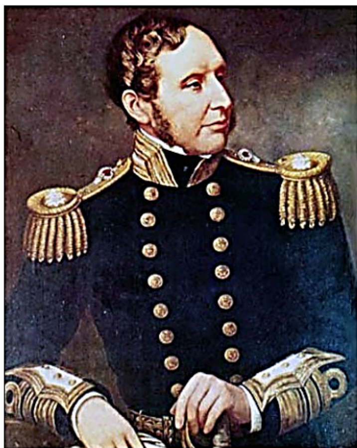
Robert Fitzroy (1805–1865), viceamiral och stormvarningssystemets grundare.

Först under tidigt 1700-tal började mer eller mindre vetenskapliga idéer kring väderförutsägelser slå rot. Problemen var att kunna samla in data tillräckligt snabbt, tolka dem rätt, göra en säker prognos och sedan nå ut till de man ville varna. Möjligheterna kom först kring mitten av 1800-talet med ökad kunskap om meteorologi och med telegrafi.